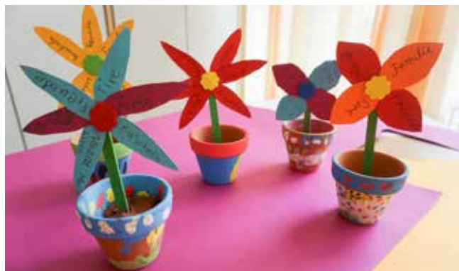
Hilfeblume - Herausarbeiten von Bewältigungsstrategien

Da die Kinder in der Gruppe sich vorab nicht kannten, wurde der Tag zunächst mit einer Vorstellungsrunde sowie dem spielerischen Herausarbeiten von Gemeinsamkeiten begonnen. Das daran anschließende Programm richtete sich nach dem Thema des Tages: „Bewältigungsstrategien“ aus, wofür eine