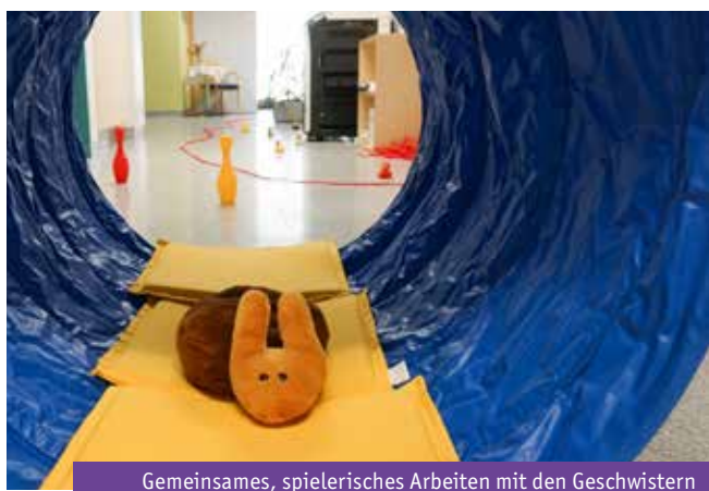
Gemeinsames, spielerisches Arbeiten mit den Geschwistern

AB: Sehr gerne. In 2024 konnten wir das Angebot für Geschwister erfreulicherweise wieder ins Programm mit aufnehmen. Die Geschwisterangebote beim Bunten Kreis Allgäu sind darauf ausgerichtet, Geschwister von Kindern mit einer chronischen Erkrankung oder Behinderung zu unterstützen. Der Bunte Kreis bietet Gruppenangebote wie den Geschwistertag an. Zudem gibt es die Möglichkeit der Einzelbegleitung.