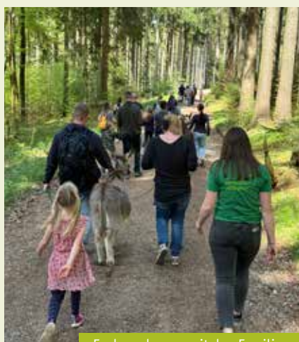
Eselwanderung mit den Familien

Im April und Mai 2024 durften die betreuten Familien des Bunten Kreises Allgäu wieder einmal ganz besondere Abenteuer erleben. Dank der großzügigen Unterstützung unserer Spenderinnen und Spender konnten wir unvergessliche Ausflüge organisieren, die den Kindern strahlende Augen und Erinnerungen bescherten. Diese Ausflüge waren nicht nur eine willkommene Abwechslung vom Alltag, sondern auch ein wichtiger Beitrag im Umgang mit ihrer chronischen Erkrankung und zur Förderung des Wohlbefindens der Kinder.