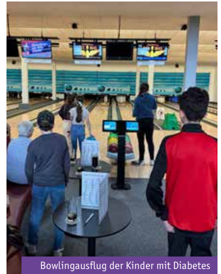
Bowlingausflug der Kinder mit Diabetes im April 2024

09:30-11:30 Uhr im Veranstaltungsraum Ebene C0 Nähere Informationen: stillberatung@klinikverbund-allgaeu.de