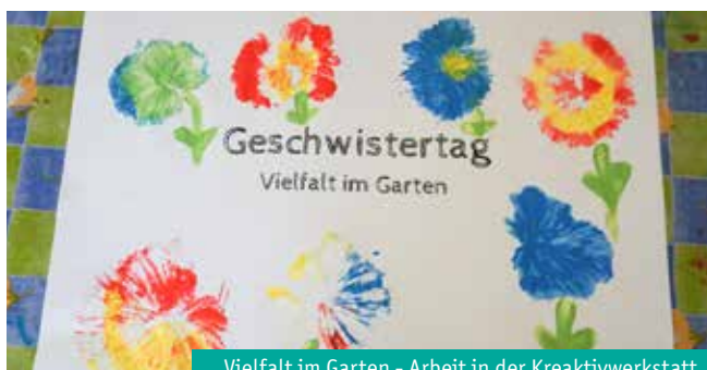
Vielfalt im Garten - Arbeit in der Kreativwerkstatt

Der Geschwistertag war ein voller Erfolg und hat den Geschwisterkindern wertvolle Erlebnisse und Erinnerungen geschenkt. Wir bedanken uns bei allen Teilnehmenden und freuen uns bereits auf den nächsten Tag dieser Art am 13.07.2024.