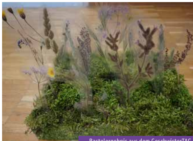
Bastelergebnis aus dem GeschwisterTAG

AB: Jederzeit per Mail unter info@bunter-kreis-allgaeu.de oder sie rufen im Bunten Kreis Allgäu an unter 0831 960 152 0 und lassen sich mit mir verbinden. Die Termine für die nächsten Geschwisterangebote „Geschwistertag“ sind aktualisiert auf der Homepage einzusehen.